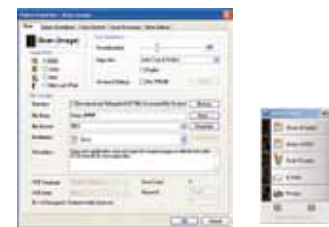
Avision's Button Manager V2

Button Manager V2 提供你一个非常迅速又容易的方法来完成扫描的工作。 只要轻轻按一下扫描仪上的「扫描」按键, 就可以完成文件的扫描, 把纸张文件转为JPEG、BMP、TIFF、PDF 或 GIF 的图档格式, 并且把图档直接连接到预设的档案夹或应用软件, 例如, e-mail、打印机、或其他影像编辑应用软件, 简化了繁杂的扫描工作。